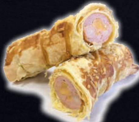
CERVELAS EN CROÛTE (AU FROMAGE)