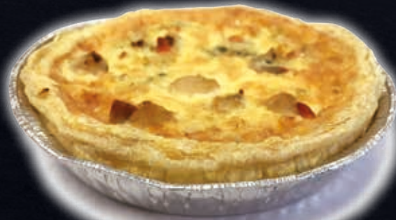
POIREAU - ST. JACQUES (PETITE QUICHE)