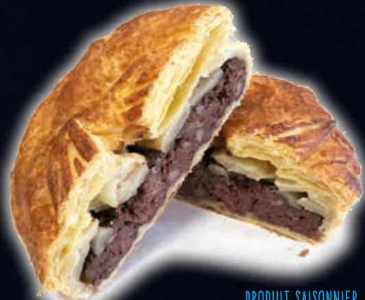
TOURTE AU BOUDIN