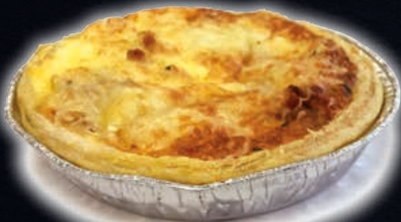
LORRAINE (PETITE QUICHE)