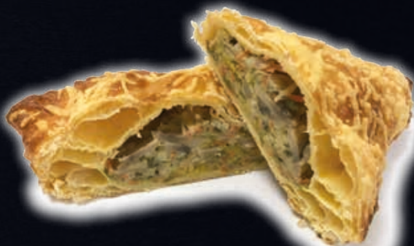
TRIANGLE DE LÉGUMES