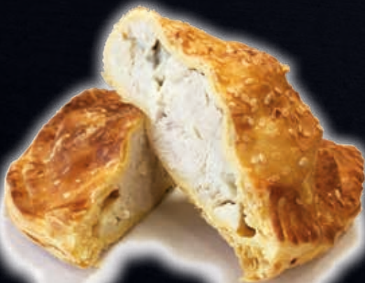
CHAUSSON À LA VOLAILLE