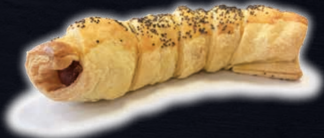
METTWURSCHT EN CROÛTE