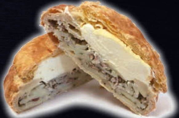
TOURTE À LA POMME DE TERRE