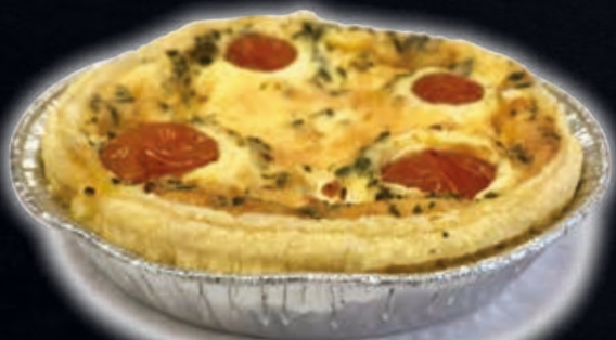
FROMAGE DE CHÈVRE - TOMATE (PETITE QUICHE)