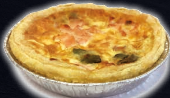
SAUMON - ASPERGES (PETITE QUICHE)