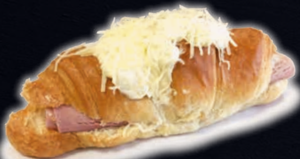
CROISSANT AU JAMBON-FROMAGE