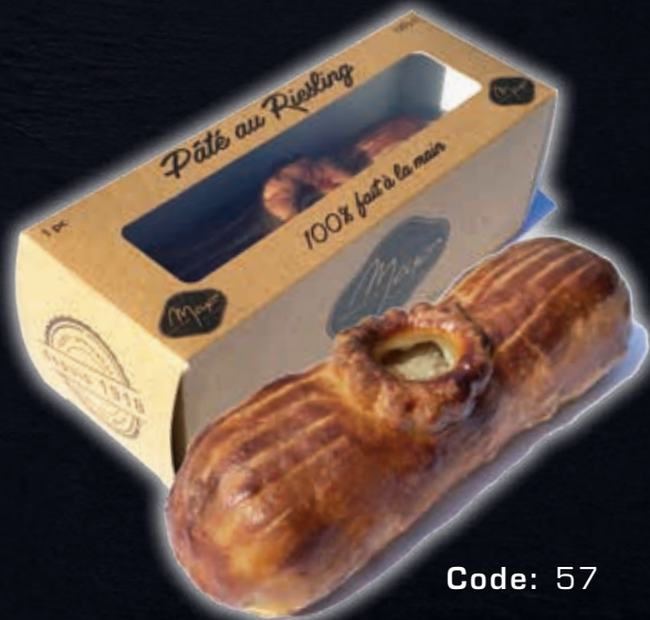
PÂTÉ AU RIESLING (130 GR.)